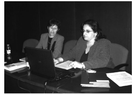
Experiència Intendència Montevideo